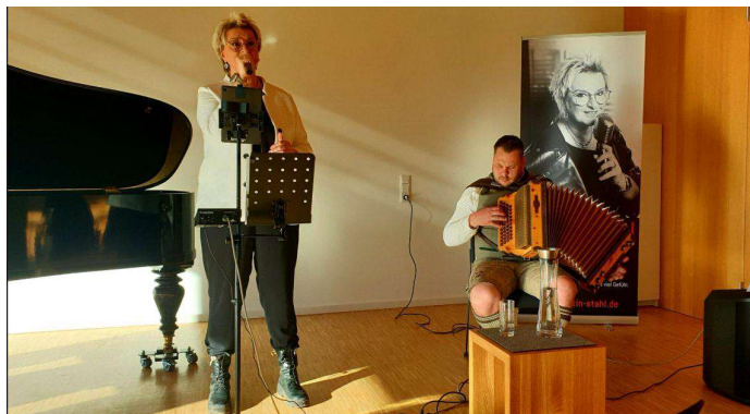
„Musikalische Atempause“ am 8. Februar auf Kohlhausen