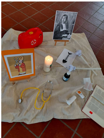
Legebild zum Thema: „Der heilige Blasius“ Familiengottesdienst Februar